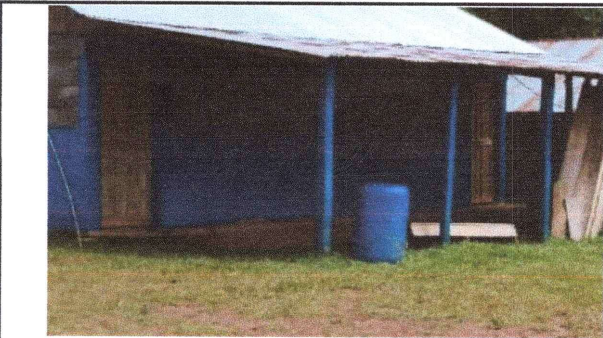
Foto 5: Sustitucion de puertas de madera por puertas de metal para la cocina del establecimiento