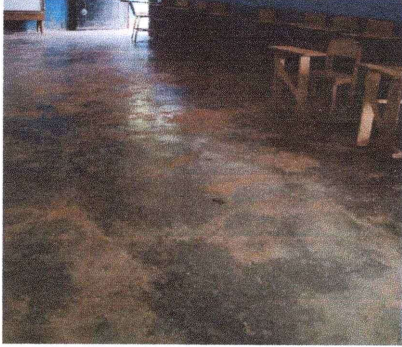
Foto1: Sustitución e instalación de piso liso por piso ceramico