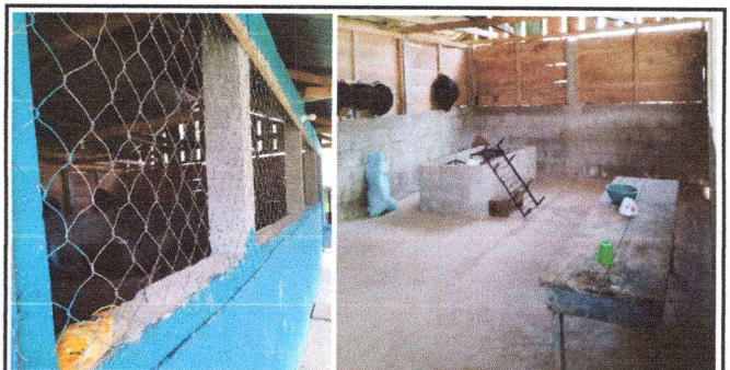
Foto 6: Sustitución de ventanas de madera y malla por balcones de metal para cacina del establecimiento.

Observación: Si es necesario se pueden agregar hojas adicionales y actualizar el número de hojas.