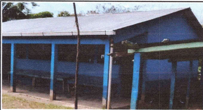
Foto 3: Aplicación a dos manos de pintura en el exterior del establecimiento.