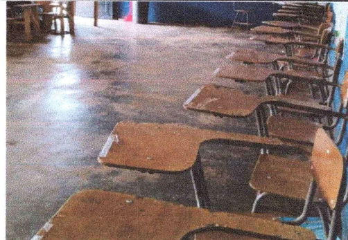
Foto 2: La sustitución del piso liso se realizara debido al deterioro que a sufrido por el paso de los años.